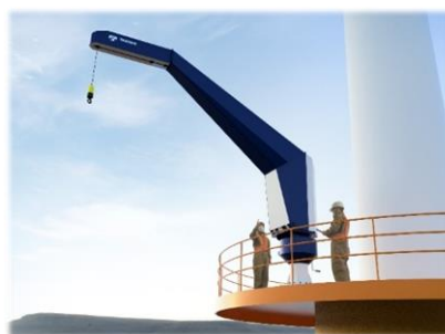
ダビッドクレーン