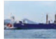
バージ船による製品海上輸送

2004年、岡山県の国道で当社製ラフテレーンクレーンによる死亡事故が発生。安全装置の不具合が要因の一つと判明し、12月に8型式16機種15,278台のリコールを届け出ました。このリコール問題を受け、「建設機械は公道を走らせていただいている」との気づきを得るとともに、「企業とは」「経営とは」という原点を見直し、翌2005年よりCSR(企業の社会的責任)推進を本格的に開始しました。2006年にはCSR憲章を制定し、CSR視点での製品開発や事業活動が進められ、2008年に志度工場の屋上に太陽光発電パネルを設置するとともに、環境負荷の少ない海上輸送のために志度港にバージ船着岸施設を建設しました。