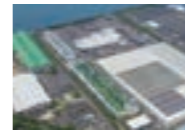
太陽光パネルの設置(志度工場)